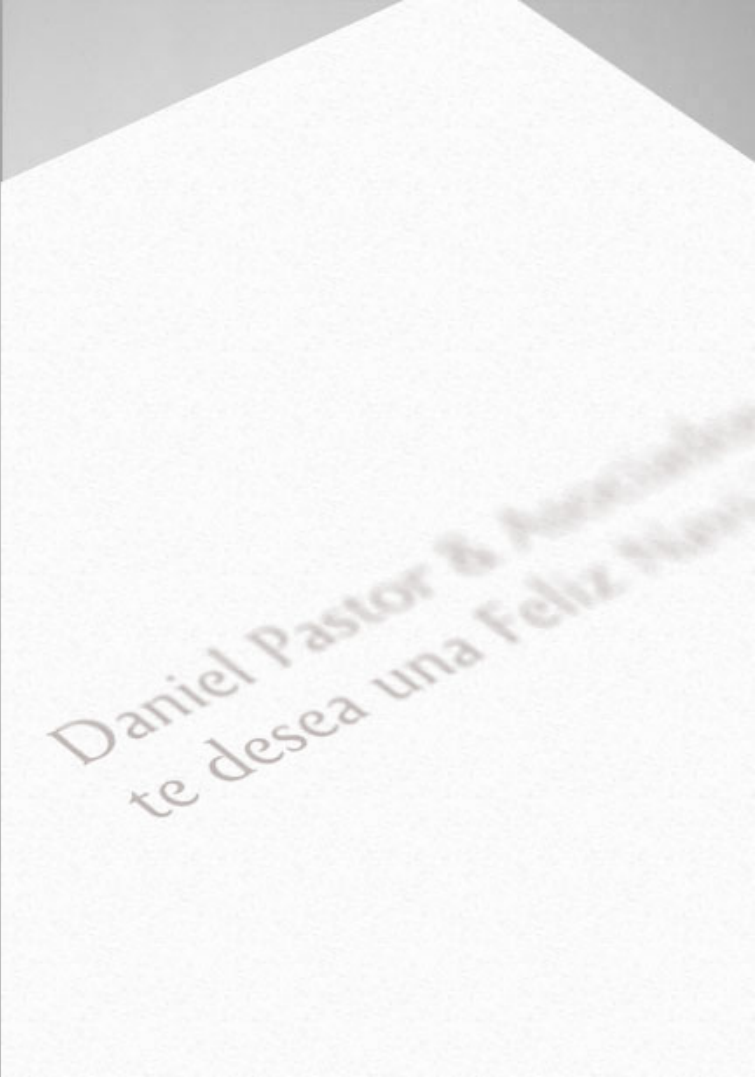
Felicitación de Navidad 2009