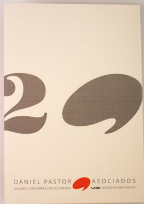
Felicitación de Navidad 2011